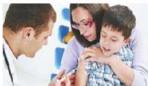
Figura 1.3 Los niños y las niñas tienen derecho a la salud y sus padres son responsables de llevarlos a vacunar.

Por ello, la ONU promulgó la Declaración de los Derechos del Niño y la Convención sobre los Derechos del Niño. En México estos derechos están protegidos en la Constitución Política de los Estados Unidos Mexicanos y en la Ley General de los Derechos de Niñas, Niños y Adolescentes, que establecen que la niñez abarca desde cero hasta menos de doce años y la adolescencia, desde doce años cumplidos a menos de dieciocho. En el esquema se incluye un listado de tus derechos.