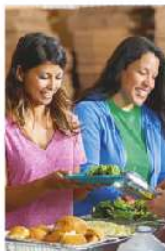
Figura 1.6 Tu dignidad se fortalece cuando actúas con honestidad, con lealtad, con reciprocidad, y respetas la dignidad de las demás personas.

Me tratan con cariño Se burlan de mí y me ponen apodos Confían en mí Respetan mis ideas y opiniones Me castigan injustamente Nadie me apoya cuando lo necesito Participo en las decisiones que me afectan Me discriminan o me molestan Si me acusan de algo me puedo defender Respetan mi forma de ser Me mienten o me ocultan lo que pasa Me hablan solo por interés