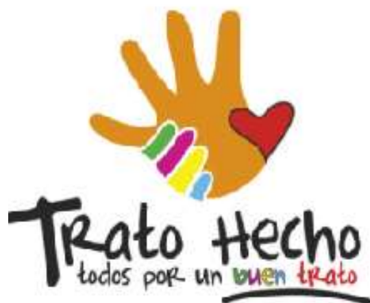
Figura 1.5 El derecho al buen trato es tan importante que en varios países los gobiernos impulsan campañas para promoverlo, como en esta, de Chile.

Tú, como todos los seres humanos, tienes derecho a disfrutar de una vida plena en condiciones acordes a tu dignidad y que garanticen tu desarrollo integral. ¿Cómo te gusta que te traten? ¿Cómo tratas a las demás personas?