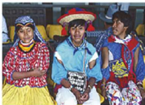
Figura 1.2 Todas las personas tienen derecho a preservar su cultura, lengua y tradiciones.

Debido a que son universales, es decir, para todos los seres humanos, existen leyes internacionales que los reconocen y protegen. Niñas, niños y adolescentes, además, necesitan derechos especiales para crecer y desarrollarse plenamente.