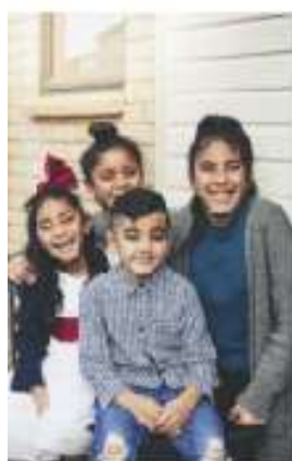
Figura 1.1 En la familia aprendemos el valor de la dignidad.