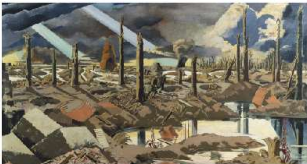
Figura 1.1 La carretera de Menin, Paul Nash, 1919.