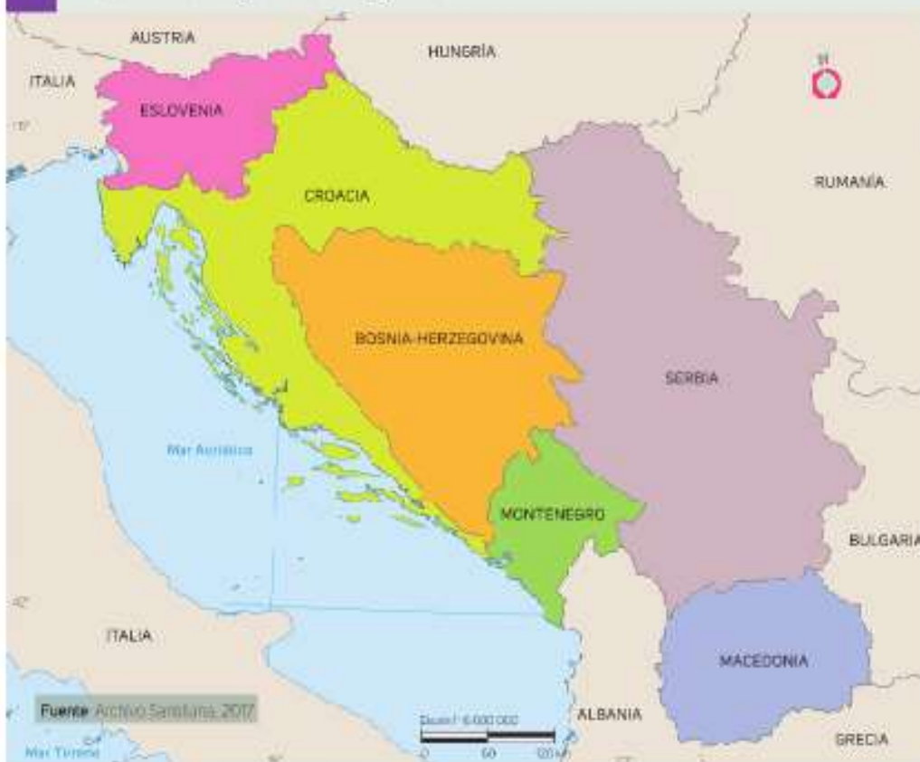
Mapa 1.1 Desintegración de Yugoslavia

En décadas recientes, la República de Yugoslavia, un país que hasta 1990 existió en Europa, cerca de la región de los Balcanes, sufrió una serie de guerras internas por diferencias políticas, religiosas y étnicas que terminaron disolviéndola en seis naciones: Croacia, Eslovenia, Macedonia, Bosnia-Herzegovina, Montenegro y Serbia (mapa 1.1).