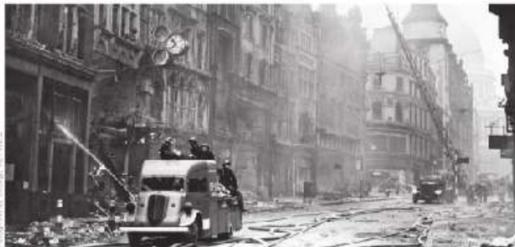
Figura 1.2 La ciudad de Londres después de los ataques alemanes del 29 de diciembre de 1940.

El resultado fue la pérdida de millones de vidas humanas, destrucción de ciudades (figura 1.2), crisis económica, política y social en los países vencidos y la modificación de las fronteras, lo que a su vez ocasionó posteriores enfrentamientos.