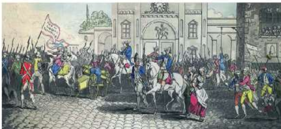
Figura 1.3 La Milicia de París se dirige a Versalles el 5 de octubre de 1789, John Wells, 1789.

Lee Hermano en la Tierra , de Robert Swindells, Biblioteca Escolar, 2001. Reflexiona sobre la importancia del diálogo para la resolución de los conflictos y el respeto a los derechos humanos.