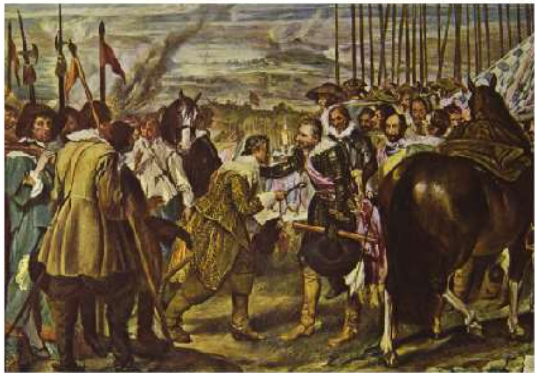
Figura 1.6 La Rendición de Breda o Los Lanzos ; Diego Velázquez, 1634.

La guerra ha sido representada ampliamente en el arte; tanto así, que podemos hallar obras, desde la Antigüedad hasta la época actual, cuya temática central son los conflictos armados. Observa el ejemplo.