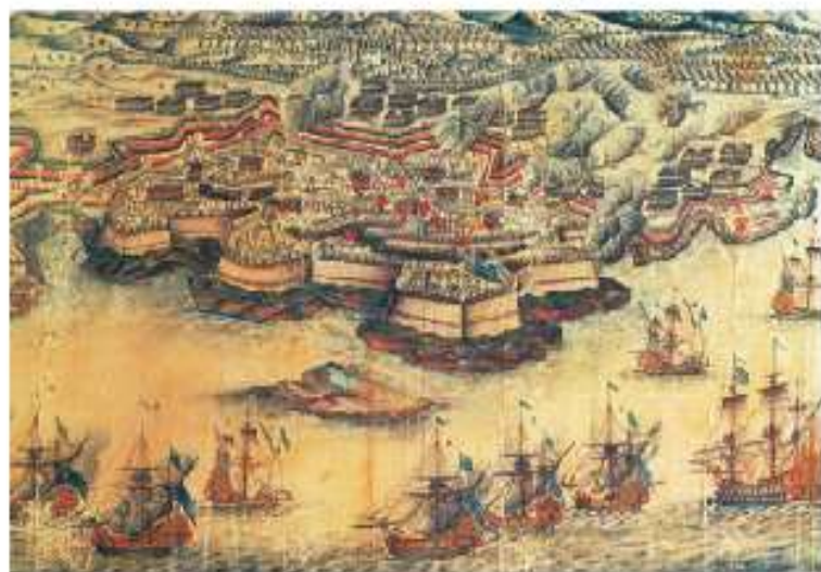
Figura 1.4 Ocupación británica de la isla de Menorca durante la Guerra de los Siete Años. Anónimo, siglo XVIII.

Los conflictos son una parte natural de la convivencia entre personas y naciones. Cuando se resuelven pacíficamente son oportunidades para analizar puntos de vista distintos del nuestro y enriquecer nuestras perspectivas. Estudiar las causas y efectos de los conflictos violentos o guerras nos permite aprender de estas experiencias. Veamos algunos casos del pasado y del presente.