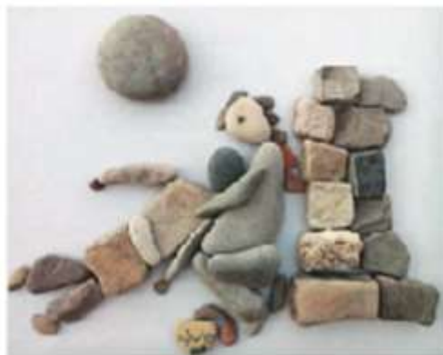
Figura 1.5 Esculturas de Nizar Alí Badr, de origen sirio, 2016.