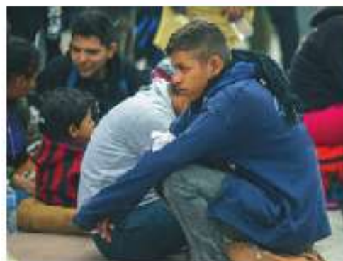
Figura 2.4 Los migrantes que más discriminación y exclusión sufren en México provienen de Centroamérica.

Cuanto más pobres son los migrantes, mayor es la exclusión y la discriminación. Siete de cada diez personas piensan que los problemas que enfrentan las comunidades son provocados por "gente de fuera", de quienes se dice que ocasionan divisiones, traen malas costumbres y debilitan las propias, son criminales y quitan empleos. Además del maltrato, suelen ser víctimas de abusos, explotación laboral y trata de personas.