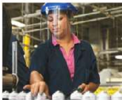
Figura 2.6 En México, el color de la piel influye en las oportunidades de desarrollo. Esta forma de discriminación se conoce como pigmentocracia.