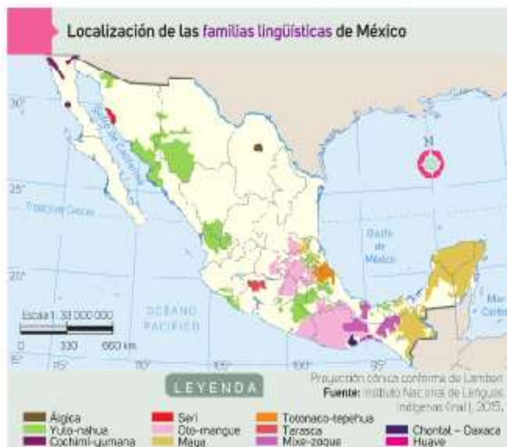
Figura 2.3 El mayor porcentaje de población indígena se localiza en el centro y el sureste del país.

No se respeta plenamente el derecho al trato digno de la población LGBTTTIQA , como tampoco a la igualdad de oportunidades, al trabajo o a una vida libre de violencia.