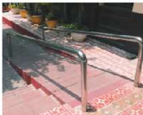
Figura 2.7 Para lograr la inclusión es más sencillo eliminar las barreras físicas que las culturales.

Retomen la tabla que hicieron en la página 90 y complementenla con la información de los diez grupos que sufren exclusión de acuerdo con la Conapred. En la cuarta columna, escriban qué harían ustedes si pertenecieran al grupo excluido.