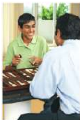
Figura 2.5 Las niñas, niños y adolescentes tienen derecho a recibir un trato digno.

Según los propios adolescentes, sus derechos no se respetan debido a que no tienen dinero, a su edad o a su apariencia. Persiste la idea de que los jóvenes son peligrosos, irresponsables, vagos, borrachos, violentos y que están permanentemente en riesgo. Casi la mitad de la población considera que se justifica en algún grado "llamar a la policía cuando uno ve muchos jóvenes juntos en una esquina".