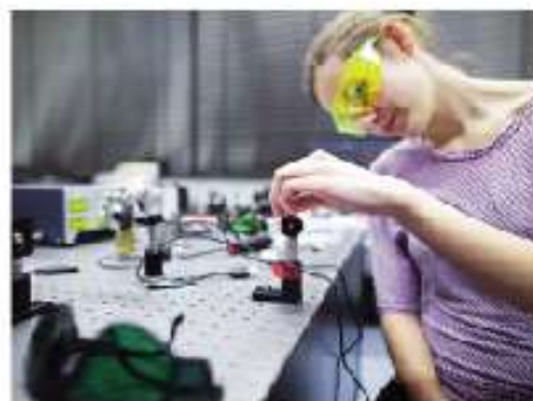
Figura 2.29 Hombres y mujeres tienen la misma capacidad para dedicarse a las matemáticas y a la ciencia.

Los vínculos de amistad también han sido influidos por los roles y estereotipos. Existe la creencia de que un hombre y una mujer no pueden ser amigos, por ello es probable que ambos hayan respondido Sí en la pregunta 13. Como a los hombres se les niega el derecho a la ternura, hace más difícil que en la adolescencia conversen sobre lo que les duele o entristece y quizá la mayoría respondió No en la pregunta 12. Por último, los cuentos de hadas y la visión devaluada de la mujer han hecho pensar que ellas son poco confiables. Esta idea ha mantenido desunidas a las mujeres y fortalecido la idea de que solo un hombre las puede salvar. Por eso quizá hombres y mujeres en la pregunta 14 contestaron Sí .