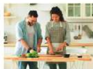
Figura 2.28 Los estereotipos generan conductas nocivas para ambos géneros, estas pueden modificarse con pequeñas acciones, como participar en las labores domésticas.

En México, 47.6% de las adolescentes de 15 años y más opina que las mujeres que trabajan descuidan a sus hijas e hijos; sin embargo, 53.4% está en desacuerdo; 69.6% cree que ellas deben ser igual de responsables que los hombres de traer dinero a la casa, aunque el resto piensa lo contrario; y 87.3% de las mujeres está de acuerdo en que los hombres deben encargarse, igual que ellas, de las tareas domésticas, de cuidar a las niñas y los niños, y a las personas enfermas y ancianas, aunque 2.7% opina que debe ser una tarea compartida.