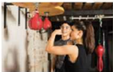
Figura 2.26 La autonomía es necesaria para que las mujeres tomen decisiones respecto a su profesión.

En equipos, lean este texto, coméntenlo y respondan.