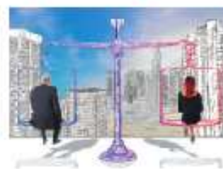
Figura 2.27 Erradicar los estereotipos de género permitirá construir sociedades más igualitarias.

Las historias de princesas o regalar muñecas a las niñas les enseña a jugar el papel de mujeres frágiles que esperan la llegada de un hombre que las reviva, las salve de su mala situación y les dé sentido a su vida convirtiéndolas en madres. Aprenden que deben ser atractivas y sensuales para conseguir pareja y satisfacer al hombre, a quien también han aprendido a ver como un ser incapaz de controlar su apetito sexual, por lo que, como el Lobo Feroz, se come a cuanta Caperucita Roja encuentra.